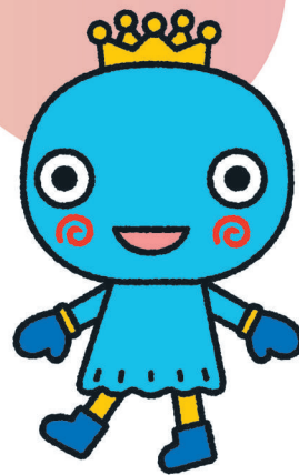
西宮市キャラクターみやたん ©たかいよしかず (無)第20220号

みやたんは、西宮の美しい川や海、お酒を作るのに欠かせない宮水、この水たちに誘われるように舞い降りた「水色の妖精」で、西宮の大切な宝物を探すために西宮のまちを旅しています。みやたんは西宮を探検することが大好きで、たくさんの人とお友達になるために、今回は廣田神社に遊びにやってきます！ ※西宮市HPより