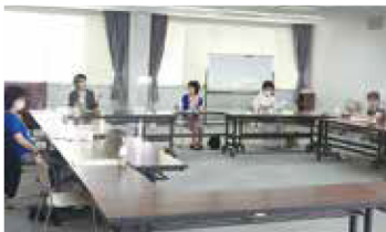
ソーシャルディスタンスを確保して開催

今年度の役員会は書面審議が続いておりましたが、7月に入り、やっと対面にて開催することができました。少人数ながら、三密を避けソーシャルディスタンスを取り、きちんと進むことができました。