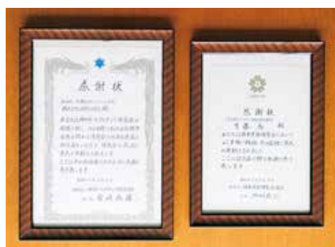
大阪や神戸の博覧会に取り組んだ際の感謝状