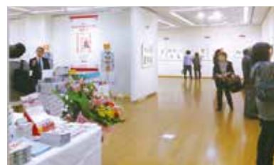
誘致当初2015年3月開催の「第9回大人の塗り絵コンテスト展覧会 関西展」の様子。今年度で第19回の開催を迎える。

PPP 事業参入当初から携わる指定管理施設では施設の管理運営を行うとともに、地域と