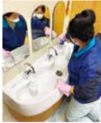
清掃業務に取り組む技能実習生の様子