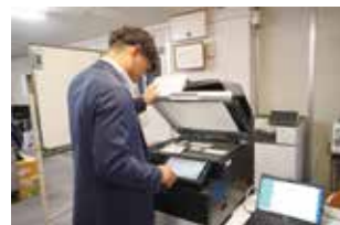
最新の複合機を活用してDXを推進