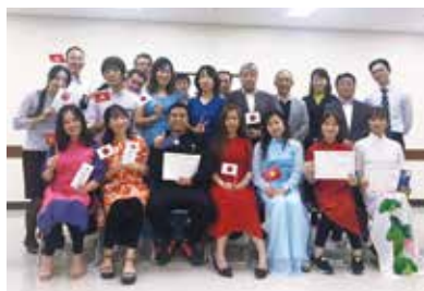
ベトナム文化交流会の様子

「当初は通訳を1名入れて業務を行っていたものの、技能実習生が日本語を学ぶことに熱心であるとともに、後から入ってくるベトナム人の後輩に業務を教える体制が整ってきました」と、京藤社長は手応えをつかんでいる。その結果、日本語能力試験でN3 10名、N2 6名、最高難易度N1 3名(延べ人数)の合格者を輩出し、「優良な実習実施者」としても認定されている。2019年にはベトナムにビルメンテナンス会社を設立。技能実習生に対して帰国後の働く場を提供するとともに、現地における人材育成にも努めている。