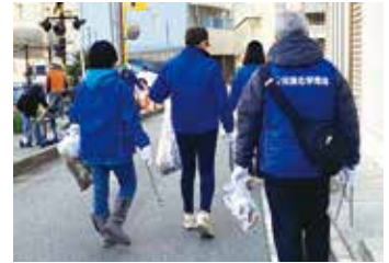
技能実習生と地域清掃に取り組む様子

同社では、西宮全域で半年に一度開催される「わがまちクリーン大作戦」に参加しており、日本人従業員に加えて技能実習生も参加して、タバコの吸殻や空き缶などの散乱ごみの回収に取り組む中で地域との交流、貢献を行っている。