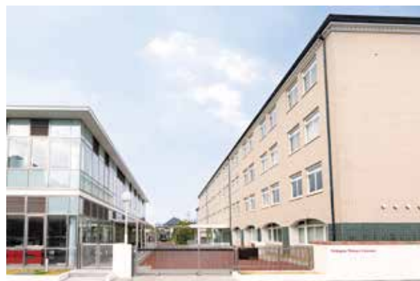
西宮北口キャンパス

同校はまた、約20万人にもものぼる卒業生に対する生涯にわたる支援をうたっており、環境の変化にともなう転職や再就職支援にも力を入れている。そのために必要なスキルをこのセンターで学べるのも特徴で、就職希望者は個別の目的に応じてリスキル科目を受講している。