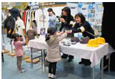
地域連携活動/ ららぽーと甲子園スマイルフェス

「MUKOJO Principles」の4つの柱の中でも、「地域や社会の発展への貢献」に関しては、2018年に西宮商工会議所と包括連携協定を締結していたこともあり、多くの会員企業とのコラボレーションが実行されている。