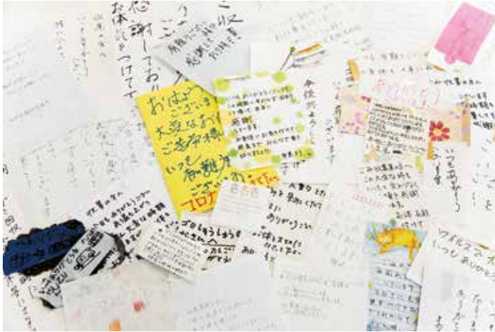
コロナ禍の時期に家庭ごみの袋に貼られていたメッセージ

グッドホールディングスグループを代表するグッドホールディングス株式会社は、傘下に持つ5つの事業会社すべてが環境に関連するものだ。ごみの収集やリサイクル、おかたづけとリユース、グリストラップ清掃、バイオガス発電へと創業から70年以上、SDGsを具現化してきた企業である。