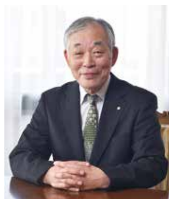
瀬口 和義 学長

85年の歴史を刻み、常にその時代の女性の生き方を先導し、挑戦を続けてきた同校。今後も時代に合わせた学問の場を提供し、日本のみならず世界に羽ばたく女性リーダーの育成に力を入れていく。