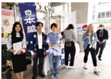
地域連携活動/ 日本盛 JAPAN SODA® 試飲・アンケート実施

2022年に竣工した西宮商工会館のデザイン提案にも同校の生活環境学部の学生が関わっている。取り組みの一部ではあるが洋菓子店「ベルン」とは、教育学部や経営学部の学生がお菓子を協同開発。清酒メーカー「日本盛」とは、経営学部の学生が新商品「JAPAN SODA®」を使ったメニューを開発し、期間限定で同校のキャンパスにある「Lavy's Café」で発売された。企業にとっても、若い感性と柔軟な発想を取り入れる良い機会だと歓迎されている。